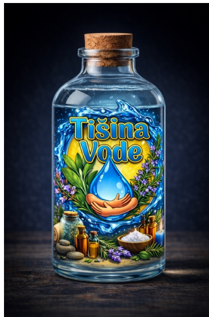
Slika 4: Voda iz konjiškega izvira z našim logotipom (Leni Modic)

Izvedemo počasno hojo okoli ribnika. Vsak korak je usklajen z vdihom. Osredotočimo se na dotik stopal s tlemi. Zaželjeno je, da so udeleženci bos, saj le tako občutijo pristen dotik.