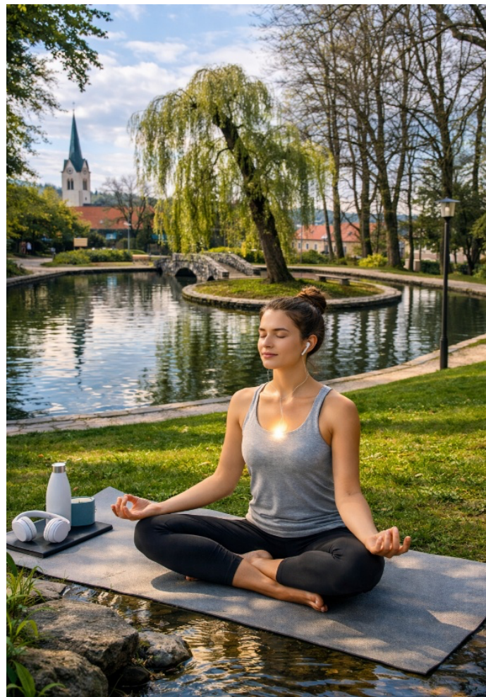
Slika 6: Refleksija na gladini

Udeleženci v tišini zapišejo ali narišejo občutke, ki so se pojavili ob opazovanju. Pomembno je, da nihče ne govori, ne komunicira z ostalimi.