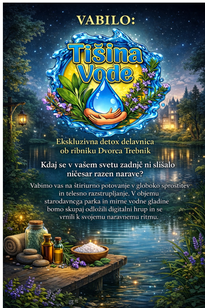
Slika 2: Vabilo na detox delavnico

Delavnica temelji na konceptu tišine in je zasnovana kot vodeno večstopenjsko doživetje, ki udeležence popelje od zunanjega hrupa do notranjega miru.