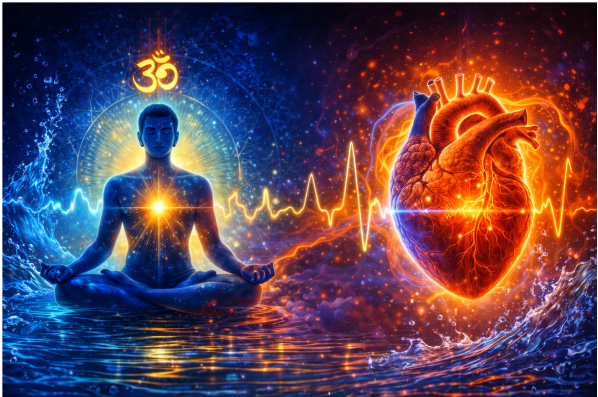
Slika 5: Vodna kopel

Udeleženci se namestijo na različne točke ob vodi (mostiček, klop, obrežje). Najprej se poglobimo v objektivni svet, kjer poslušamo oddaljeno žuborenje vode. Nato se osredotočimo na notranji svet, kjer poslušamo lastni utrip. Zvok tekoče vode deluje, kot beli šum, ki prekrije moteče zvoke iz okolice in mir možganske aktivnosti. Ritmično pretakanje vode pa znižuje srčni utrip in raven stresnega hormona.