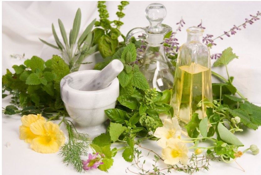
Slika 7: Branje misli in zeliščno-sadne dobrote

Po opravljeni delavnici se skupaj zberemo na skupni točki - na sredini parka na travi. Udobno se namestimo. Svoje zapisane misli preberemo in kar je pomembno, o njih se pogovorimo. Velikokrat se misli nanašajo na vizualizacijo, torej, kaj vidimo (podobe, barve, kraje), največkrat pa so to čustva, ki so prispela na plano (radost, mir, sreča, žalost) Po zaključni delavnici ponudimo zeliščne dobrote, vodo, čaj in sveže sadje z jogurtom ali samo sveže sadje.