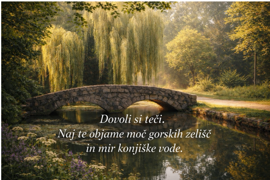
Slika 1: Ribnik

V samem mestu Slovenskih Konjic, se nahaja manjši, parkovni ribnik. Najdemo ga pod Dvorcem Trebnik, ki je del mestnega parka in ponuja sprehod v naravi. Je zgodovinski biser s koreninami v 14. stoletju. Čez ribnik vodi slikovit lesen mostiček, ki je zelo priljubljena točka za fotografiranje. Ribnik obdajajo urejene poti, v bližini pa se nahajajo zeliščni vrtovi, otroško igrišče, ter kipi, ki bogatijo park. Ribnik predstavlja del kulturne dediščine dvorca in nudi dom vodnim pticam ter mirno okolje za obiskovalce. Danes služi kot stičišče preteklosti in sodobnega turizma. Je idealna lokacija za sprostitev in rekreacijo.