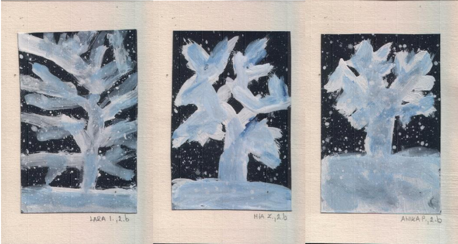
JARA I., 2.b