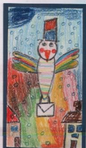
ROVANA JACOB 5,6