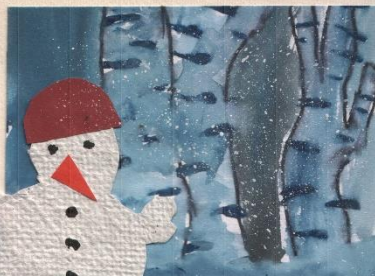
KATARINA MAJA, 5,5